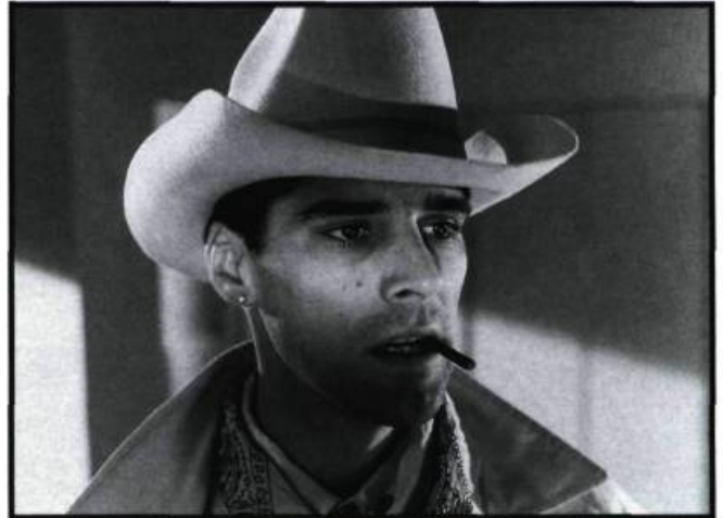
David (Thomas Gibson).

Au Québec, parce que le monde est un peu plus petit qu'ailleurs, l'oubli ou la mise au rancart sont choses fréquentes, ou en tout cas possibles. Quant aux cinéastes qui mûrissent avec les ans, ils représentent mon seul espoir (rires). Du reste, je suis quelqu'un de lent, qui apprend lentement. Si le temps n'est pas de mon bord et si je n'ai pas la conviction qu'il est de mon bord, alors il est inutile que je continue. On ne tourne pas pour faire des films de plus en plus mauvais, on tourne pour faire des films de mieux en mieux ficelés. Et je crois, ou du moins j'espère qu'il en va ainsi avec mes films. ■