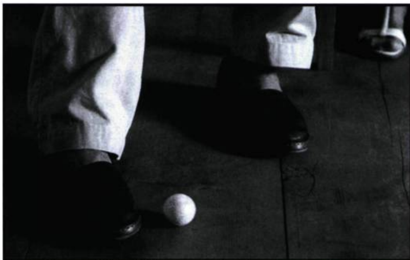
Funny Games . «L'efficacité du recours au hors-champ pour suggérer la violence.»

Michael Haneke se trouve en terrain connu, puisque déjà 71 fragments d'une chronologie du basard (1994) terminait une trilogie sur la violence des médias. Non sans provocation, c'est le regard même du spectateur que Haneke remet encore une fois en question, sommant celui-ci de s'interroger sur son consentement à se laisser manipuler, sur sa complicité, plus ou moins consciente, voire sur son voyeurisme face aux images qui lui sont présentées. À cet égard, une séquence, la plus forte du film en partie à cause de l'endroit où elle trouve à s'insérer dans le cours du récit, se joue du spectateur en convoquant le hors-champ d'une façon terriblement efficace, dans la plus pure tradition du thriller, en privant le spectateur de tout repère sonore, afin de lui faire partager l'angoisse du mari qui, comme le spectateur, imagine le pire alors que sa femme s'est momentanément absentée vers la cuisine afin de se défaire de ses liens. Haneke se conforme ici au genre, plus qu'il ne le détour-