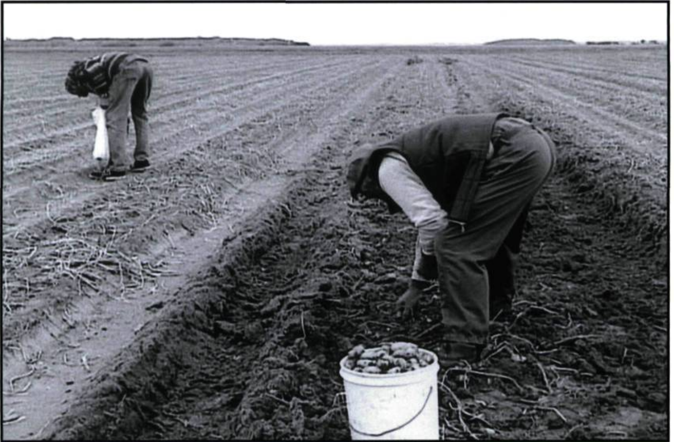
Se pencher pour se nourrir de ce que rejette notre société aux exigences étranges.

que c'était un exercice, comme un pianiste qui répète. Et puis, la réponse à la solitude, que je connais, c'est les autres, aller vers les autres, ne pas attendre qu'on vienne vers soi. Ça me semble juste à ce moment de ma vie, ce n'est rien d'exceptionnel, j'ai fait ce que je sentais que je devais faire. Maintenant les gens aiment bien le film, ils me remercient, ils sentent que j'ai été une passeuse, que j'ai fait connaître des gens extraordinaires qui donnent plutôt confiance dans l'humanité.