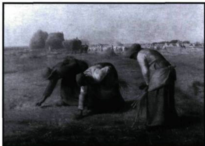
Les glaneuses de Jean-François Millet.

mener en France tout en rencontrant des gens qui, sérieusement ou avec humour, expriment comment ils sont obligés de vivre de notre gâchis. Sujet sérieux, fait de société sérieux, mais sérieux relatif dans ce sens que nous vivons tous au milieu de ça, nous vieillissons (moi en tout cas) au milieu de tout ça. Mais ces mêmes mains qui vieillissent serrent des mains qui se tendent, ou qui ramassent des patates. Ces mêmes mains peuvent aussi jouer, je joue virtuellement avec les camions. Je profite de tout ce que les caméras numériques peuvent m'offrir, comme de filmer avec une main mon autre main. Tout cela m'a semblé très riche.