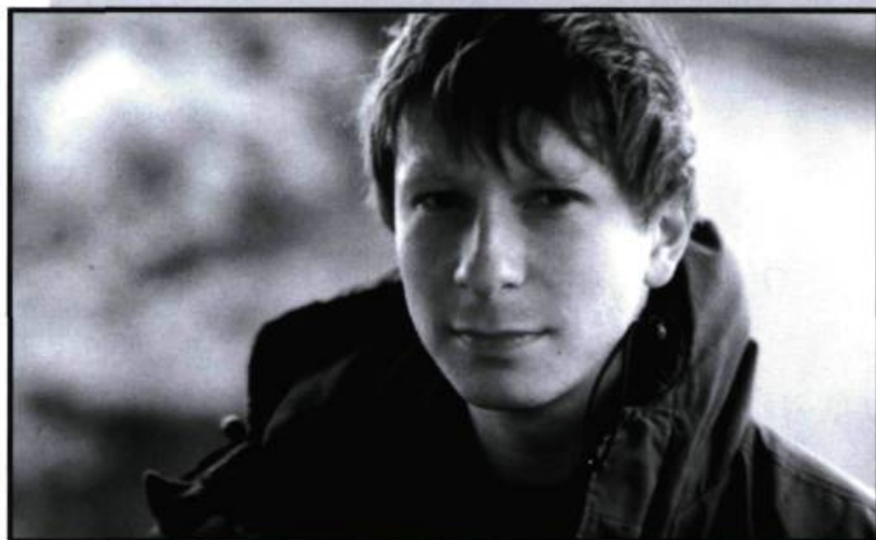
Paul Ahmarani. Nul autre acteur n'aurait pu jouer comme lui son rôle dans La moitié gauche du frigo de Philippe Falardeau.

C'est tout le contraire pour Luc Picard. Sans avoir vraiment fait sa marque au théâtre, où il est passé à côté de rôles majeurs par manque de coffre et de souffle ( Alceste et Lorenzaccio ), le cinéma lui est tombé dessus et ne le lâche plus. Il y est effectivement plus à l'aise qu'au théâtre mais (sauf Falardeau, un réalisateur de second ordre) aucun cinéaste ne lui est attaché, aucun n'a entrepris avec lui un travail de fond, et on n'a vu personne lui être de quelque utilité pour évoluer. On le «caste» à la gueule, qu'il a photogénique, et au sentiment, qu'il produit à volonté, sachant tirer sur la larme à la manière d'un chien battu; il passe du thriller au mélo comme du petit coin au salon, et, comme Rémy Girard dans les années 80, la surexposition le guette et le saisira peut-être avant qu'il n'ait réussi à tenir un vrai grand rôle à l'écran.