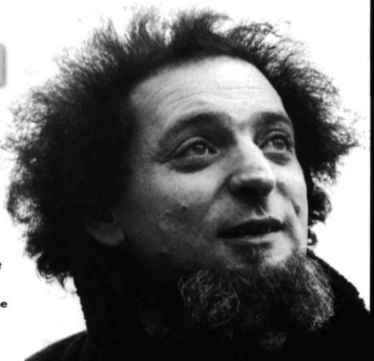
Georges Perec en 1975.