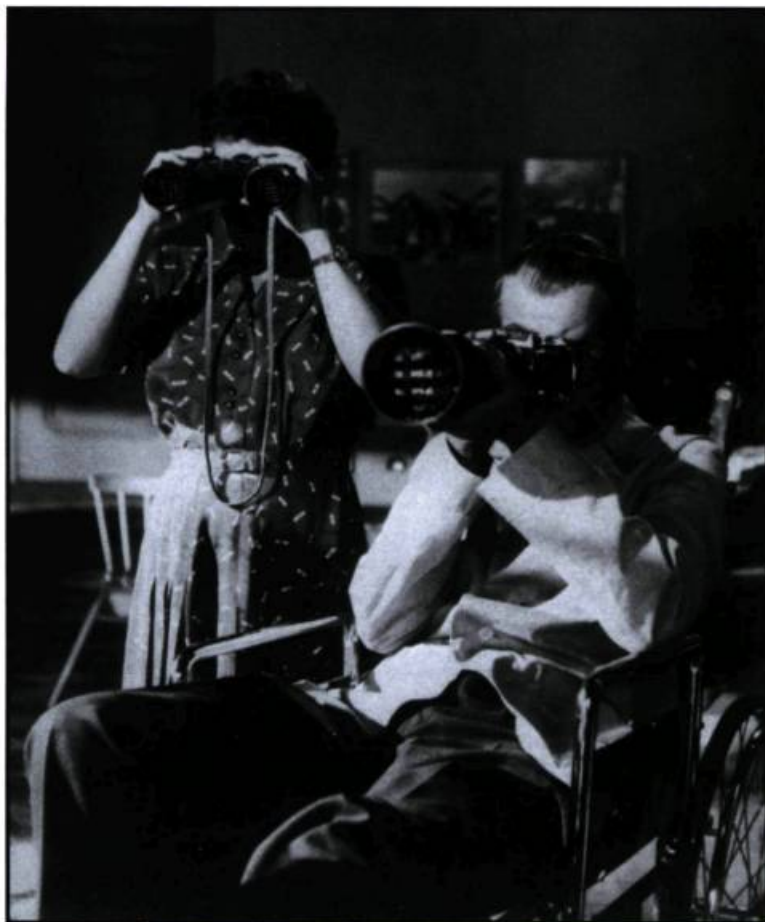
Rear Window de Hitchcock, la plus extraordinaire mise en abîme du cinéma par lui-même.

lement ces œuvres dont le regard critique, moins frontal mais certainement aussi révélateur, s'inscrit à un niveau plus allégorique.