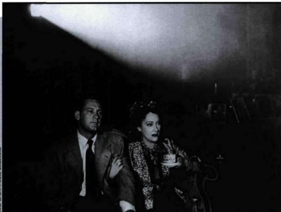
Sunset Boulevard de Billy Wilder (1950). Un commentaire à peine déguisé sur le déclin de Hollywood.

P armi les symboles de la culture et de l'idéologie américaines au XX e siècle auxquels le cinéma s'est intéressé, il est significatif que la Mecque du cinéma, Hollywood, figure en bonne place et ce, depuis les débuts du cinématographe. On ne compte plus en effet les films que Hollywood a consacrés à l'industrie cinématographique elle-même, de Sunset Boulevard à Hollywood Ending , des œuvres muettes de Sennett à celles, postmodernes, de David Lynch ou des frères Coen. Il n'y a en réalité rien de bien surprenant à ce phénomène; dès lors que le cinéma (comme la guerre, le crime organisé ou la prohibition, en fait) s'est révélé un aspect prédominant de la culture et de l'actualité, il apparaissait normal qu'il devienne un thème à part entière, exploité comme tel par l'industrie. Qui plus est, dans la mesure où cette usine à rêves qu'est rapidement devenu Hollywood générait dans la population une curiosité et une convoitise quasiment sans limites, se prendre soi-même pour objet devenait en quelque sorte pour la gent hollywoodienne une manière d'exploiter sa propre plus-value, une façon de faire jouer les mythes qu'elle avait contribué à forger.