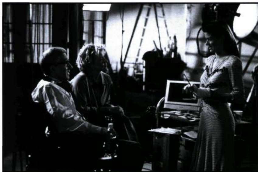
Hollywood écorché par Woody Allen dans Hollywood Ending .

l'indépendance artistique à des moyens considérablement plus importants.