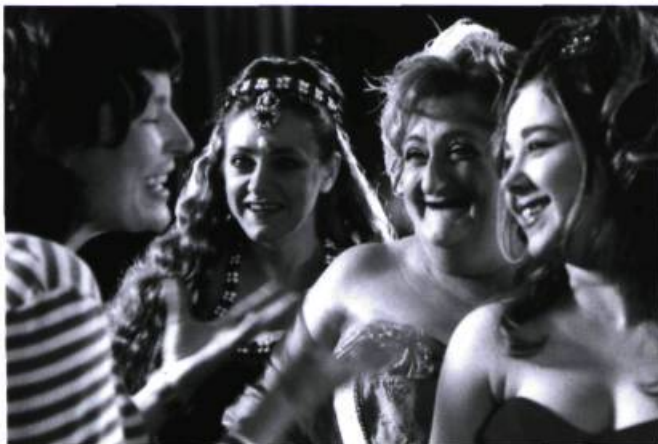
Trois princesses pour Roland d'André-Line Beauparlant.

A.-L.B. : Une fois que le film est terminé, il a sa vie propre. J'ai tout fait pour qu'il soit le meilleur possible et, bien sûr, j'espère qu'il sera vu plus que deux semaines à Ex-Centris, mais une fois qu'il sort, il ne m'appartient plus. Je ne veux pas penser qu'il