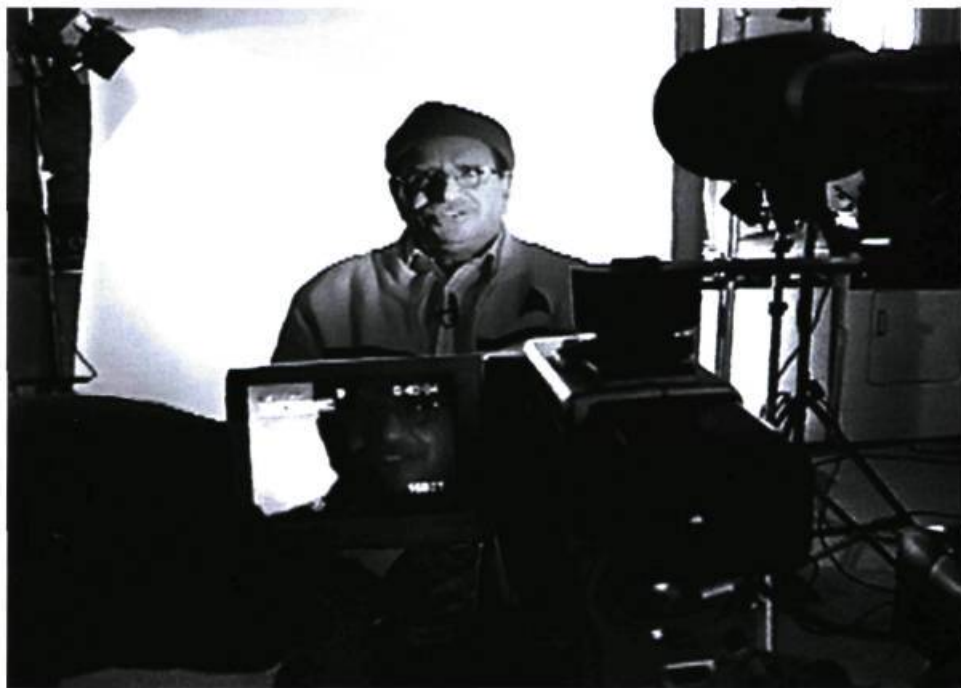
L'histoire d'une vie bricolée en cinéma.

Saint-Tite (documentaire à tendance socio-culturelle). Il semble bien que le film se contente d'exister, de « raconter une histoire », un peu folle, irréaliste comme une douce rêverie, ancrée dans un réel terne qui chercherait à s'en sortir à la manière d'un Stranger Than Paradise dont il semble un lointain cousin, y compris par son esthétique noir et blanc et son rythme oscillant entre nonchalance et contemplation. Jimmywork se refuse le droit d'être exemplaire, de distiller une quelconque morale, pour se situer hors cadre et ne ressembler à rien d'autre qu'à lui-même. Plus qu'une docu-fiction, Jimmywork est la tentative ludique de brouiller les genres, intégrant du même coup les deux tendances lourdes du cinéma québécois contemporain : l'héritage du cinéma direct, façon Robert Morin, et Hollywood et ses genres codifiés. Du cinéma direct, Simon Sauvé aura retenu la liberté et une certaine poésie du réel. Des formes canoniques des genres hollywoodiens, il ne reste que des morceaux de bravoure, comme des clin d'œil ou des hommages aux grandes formes qui peuplent notre imaginaire à