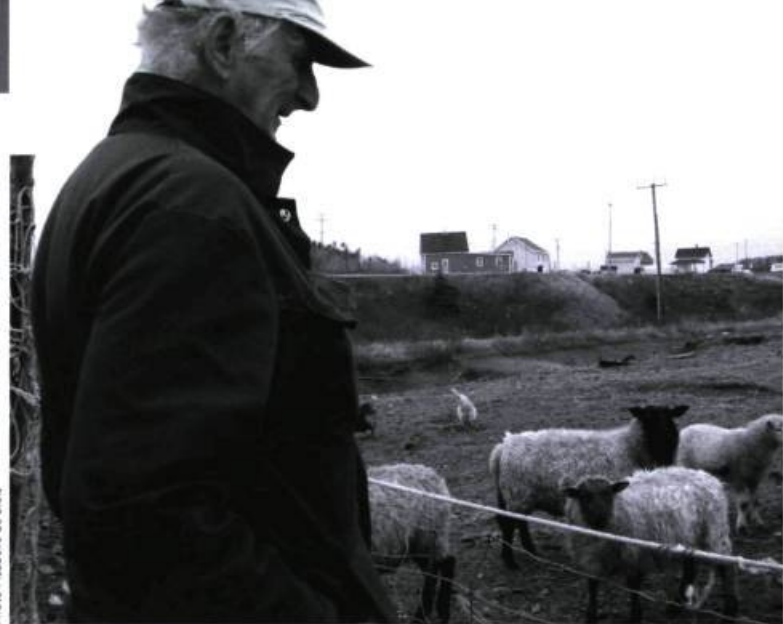
Le temps des Madelinots de Richard Lavoie.