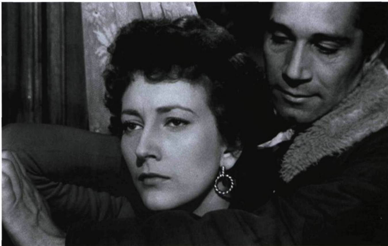
Thieves' Highway de John M. Stahl (1949).

et nuancé du cinéaste sur ses personnages : ni bons ni méchants, mais des hommes et des femmes en mal d'affection, qui rêvent leurs vies et finiront tous par perdre l'être qu'ils aimaient. Chacun d'entre eux, aussi petit soit-il, trouvera ici le temps d'exister. Par son rythme haletant, la composition savante mais jamais ostentatoire de certains plans et l'heure nocturne du récit, la mise en scène dynamique de Dassin exprime parfaitement la course éperdue de Fabian (Richard Widmark). La superbe scène de lutte entre l'Étrangleur et Gregorius, que sa longueur même et l'absence de musique rendent très émouvante, atteste en outre de la grande sensibilité du cinéaste. Elle transparaît aussi dans nombre de plans où les personnages apparaissent pensifs et silencieux, et dans une topographie expressive de l'action. Quelques images continuent de nous habiter bien après la projection : Gene Tierney pleurant recroquevillée au bas du cadre, le fils de Gregorius et ses hommes de main courant au loin sur un pont, puis assistant immobiles – tels des anges noirs posés sur la ville – à la mort de Fabian.