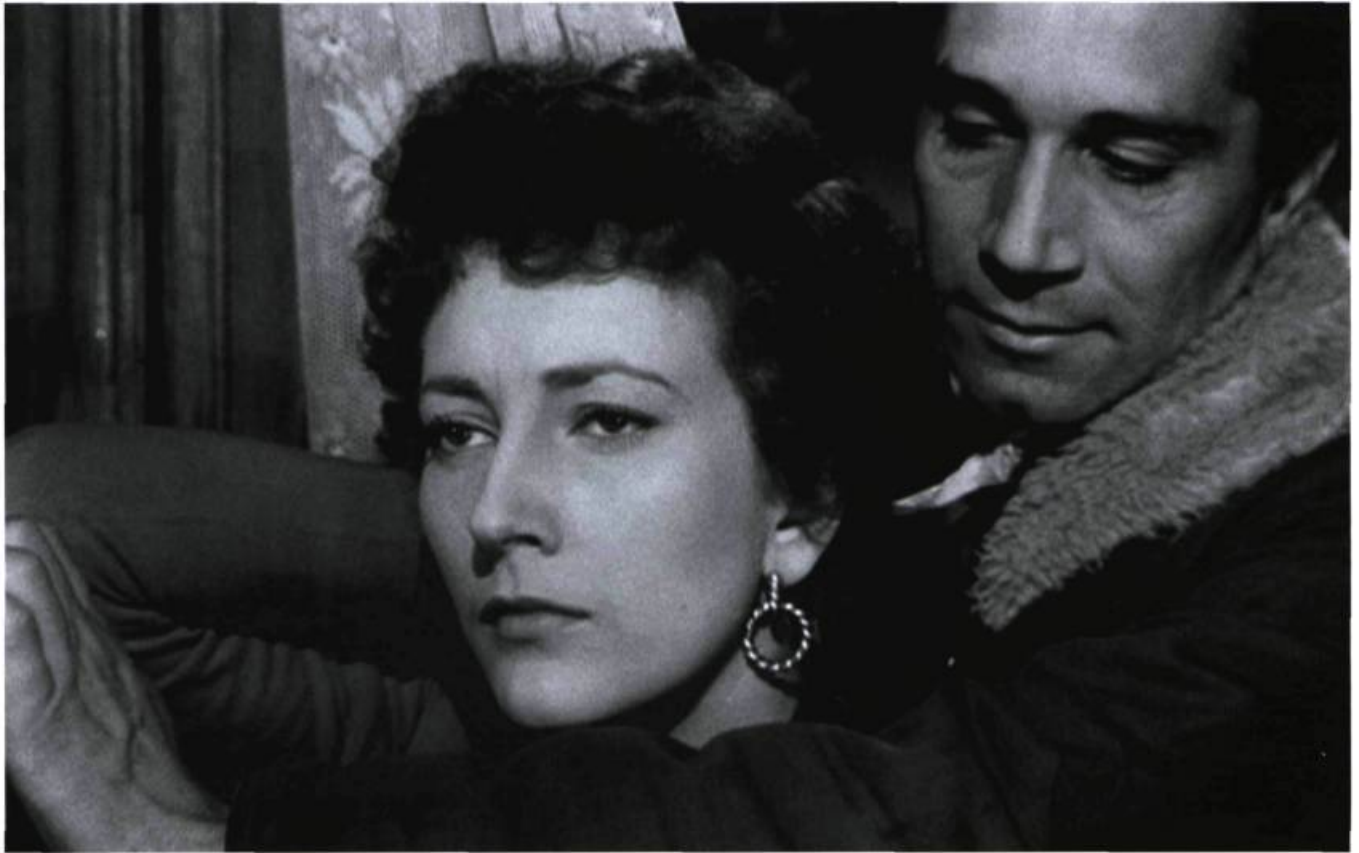
Thieves' Highway de John M. Stahl (1949).

et nuancé du cinéaste sur ses personnages : ni bons ni méchants, mais des hommes et des femmes en mal d'affection, qui rêvent leurs vies et finiront tous par perdre l'être qu'ils aimaient. Chacun d'entre eux, aussi petit soit-il, trouvera ici le temps d'exister. Par son rythme haletant, la composition savante mais jamais ostentatoire de certains plans et l'heure nocturne du récit, la mise en scène dynamique de Dassin exprime parfaitement la course éperdue de Fabian (Richard Widmark). La superbe scène de lutte entre l'Étrangleur et Gregorius, que sa longueur même et l'absence de musique rendent très émouvante, atteste en outre de la grande sensibilité du cinéaste. Elle transparaît aussi dans nombre de plans où les personnages apparaissent pensifs et silencieux, et dans une topographie expressive de l'action. Quelques images continuent de nous habiter bien après la projection : Gene Tierney pleurant recroquevillée au bas du cadre, le fils de Gregorius et ses hommes de main courant au loin sur un pont, puis assistant immobiles – tels des anges noirs posés sur la ville – à la mort de Fabian.