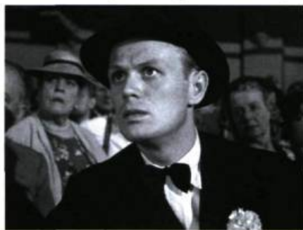
Night and the City de Jules Dassin (1951).

ment cette pensée de Pascal : l'important n'est pas tant de savoir si telle entité existe ou non, mais de s'interroger sur les avantages que l'on a à croire que cette entité existe ou non. Quant à l'enjeu romanesque du film, il éclate le temps d'une grande scène lyri-