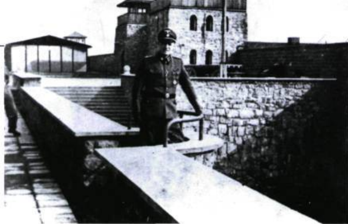
Nuit et brouillard (1955).

A lain Resnais, dans un entretien en 1994, riait de l'histoire du képi, non pas encore mais enfin , car en 1955 lorsqu'il projeta son documentaire Nuit et brouillard devant le Comité de censure du cinéma français et qu'un petit képi fit grand problème, l'ambiance était lourde, il pensait d'ailleurs que ce court métrage sur les camps de la mort en Allemagne nazie (une commande du Comité d'histoire de la Seconde Guerre mondiale) ne sortirait pas sur les écrans.