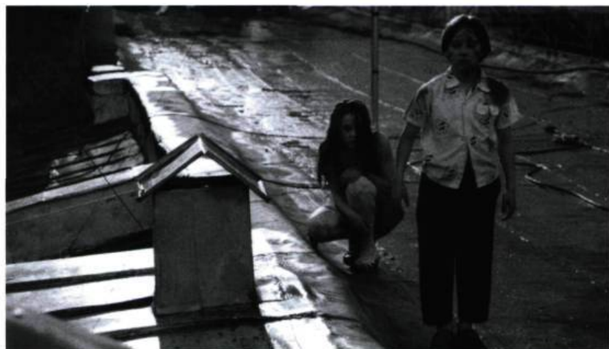
Night Watch (2004).

N.B. : Les chiffres cités sont tous issus de deux revues russes professionnelles, Kinobusiness et Kinoprotsess .