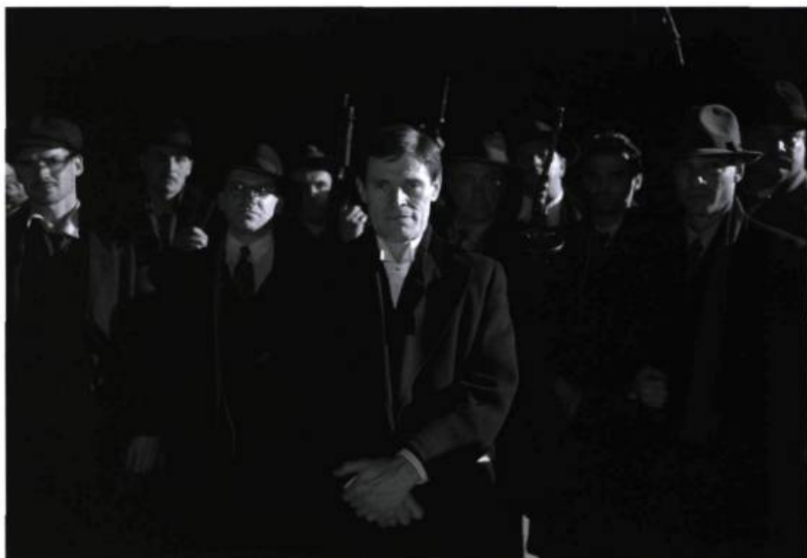
Lars von Trier, un des incontournables cinéastes de la négativité.

Depuis Breaking the Waves , Les idiots , Dancer in the Dark (qui formaient déjà une trilogie) et Dogville , les mélodrames de LVT sur le bien et le mal, la loi et l'injustice ont constamment été soutenus par un personnage féminin, devenu figure sacrificielle comme dans la tragédie grecque (on pense à Eschyle). On peut, dans la mouvance féministe, mais sans renier un pan de la culture occidentale, refuser cette féminisation de la culpabilité. Il est vrai que cette Grace n'est