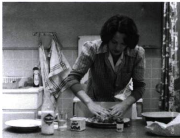
Jeanne Dielman, 23, quai du Commerce, 1080 Bruxelles (1975).

à l'intérieur du cadre, y entrent ou le laissent vide, ou encore semblent y être tout simplement échoués, esseulés et insomniaques. Le talent d'Akerman pour filmer l'entrée des corps dans un plan et leur sortie, pour chorégraphier leur danse et leurs postures, pour filmer l'invisible (ici non pas le temps mais le désir, ce fil qui fait tenir les plans du film ensemble), est illustré ici magistralement. Le féminin y est célébré plus que tenu à distance, il est affaire de robes virevoltantes aux tissus moirés, de ceintures dessinant des tailles de guêpe, il est mise en scène et appât. C'est par le burlesque qui gagne les