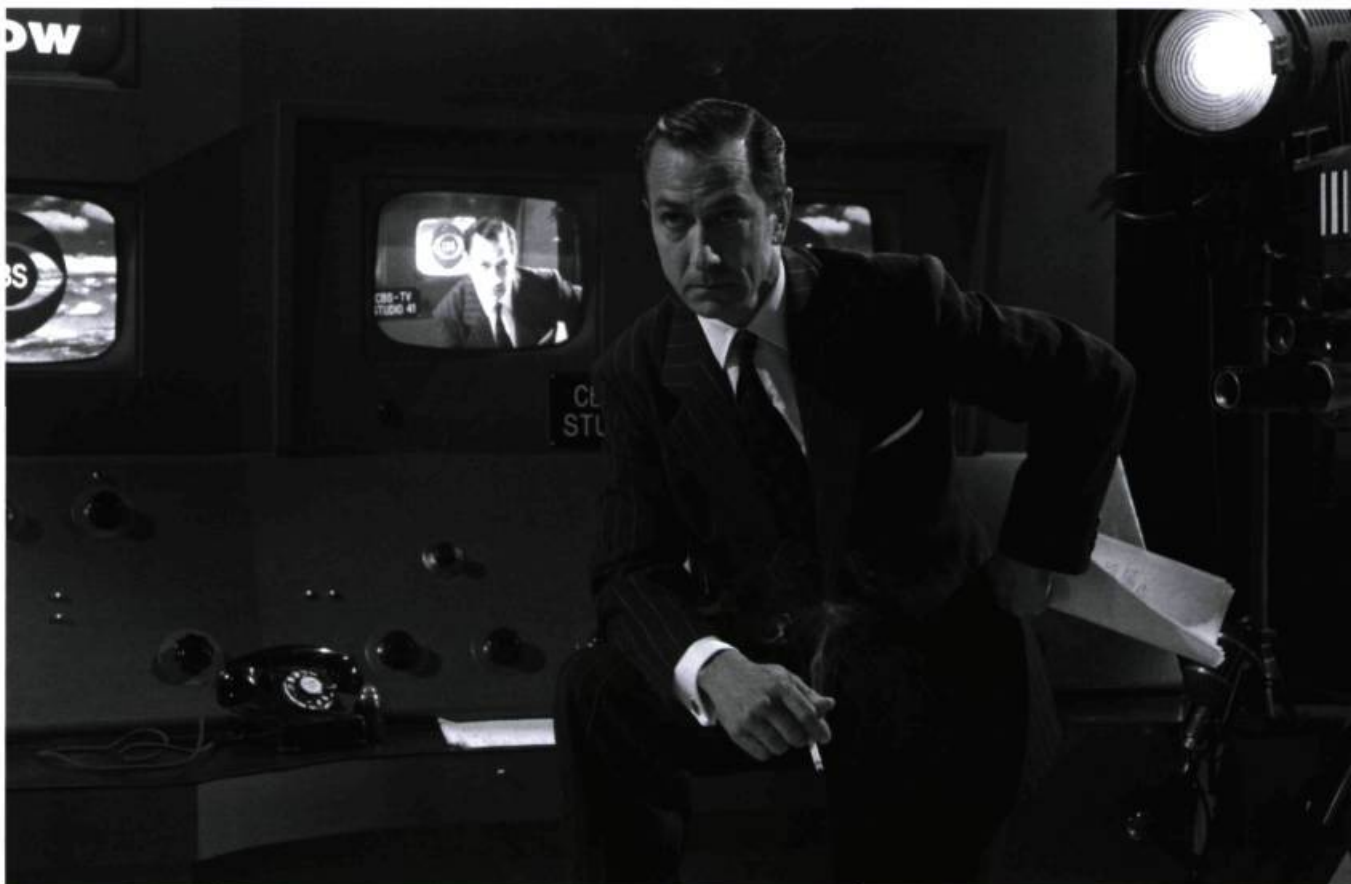
David Strathairn incarne le journaliste Edward R. Murrow dans Good Night, and Good Luck de George Clooney.

On considère généralement que la place des acteurs dans le cinéma américain décline depuis au moins vingt ans au profit des effets spéciaux. Pourtant, on assiste parallèlement au retour d'un cinéma d'acteurs principalement centré sur l'incarnation de personnages réels, de figures historiques, comme s'il fallait répondre à l'imaginaire débridé de Star Wars , de The Lord of the Rings , de King Kong ou de The Day After Tomorrow par un simple retour de la réalité, par une prétention documentaire qui vient faire contrepoids aux excès mythologiques de la fiction, par la mise en scène d'individus dont les destins exemplaires ne peuvent être remis en question.