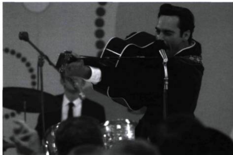
Joaquin Phoenix dans la peau de Johnny Cash dans Walk the Line de James Mangold.

C'est donc à l'écart des blockbusters que les acteurs s'éclatent et, surtout, qu'ils parviennent à se faire un nom. Car son Oscar remporté pour sa prestation dans un film à petit budget (8 millions), Charlize Theron le rentabilise en tenant le rôle titre d' Aeon Flux (budget de 62 millions). Idem pour Halle Berry qui obtient la pré-