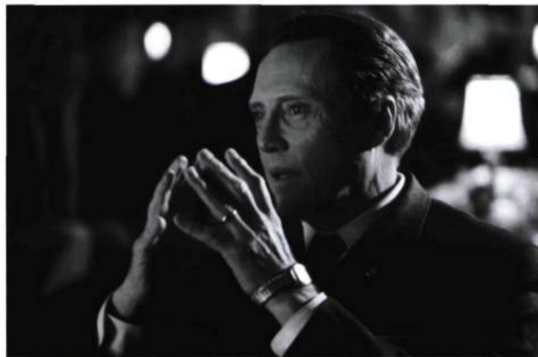
Christopher Walken dans Catch Me if You Can de Steven Spielberg.

On ne s'étonnera donc pas de voir le biopic continuer de prospérer. À 40 millions de dollars, un film comme Ray – avec Oscar à Jamie Foxx à la clé – fait la fortune de ses producteurs. Soixante-quinze millions de recettes aux USA seulement. Même le confidentiel Pollock , avec son budget de film québécois (6 millions) est rentable, et que dire de De-Lovely , qui avec son budget de 4 millions a amassé localement plus de 13 millions de recettes.