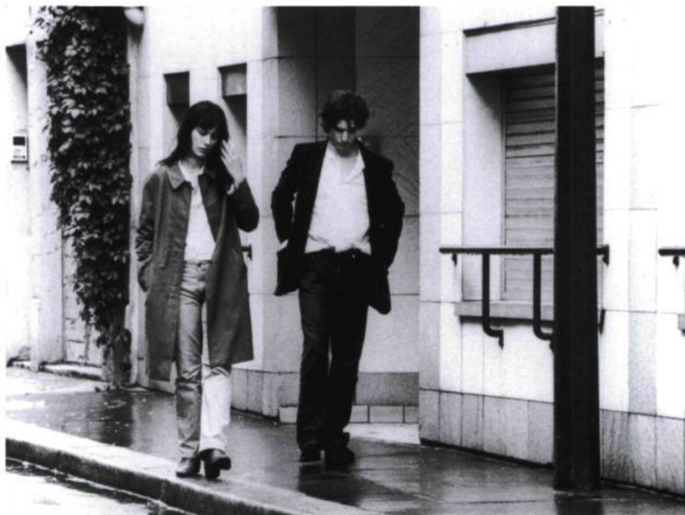
Les personnages de ce film sont des revenants, des fantômes, des survivants.

Sortie DVD à la Boîte noire : 7 novembre 2006