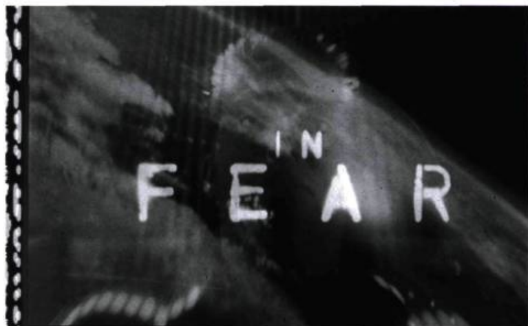
Trois images tirées d' Industry/industrie de Richard Kerr : l'art de détourner les bandes-annonces.

On m'a demandé, à titre de praticien de longue date et de professeur qui enseigne le cinéma d'avant-garde, de réfléchir à l'avenir du septième art. Comme enseignant, je travaille avec une génération d'étudiants dont les principales préoccupations se résument à : « Qu'est-ce que le cinéma ? » ou, débat plus brûlant d'actualité, « Qu'est-ce qui n'est pas du cinéma, ou quel avenir pour le cinéma ? » En fait, ce que ces jeunes veulent savoir, c'est : « Comment vais-je m'en sortir et trouver ma place plus tard ? » Quant à moi, je serais tenté de dire que les questions sur l'avenir du cinéma sont plus ennuyeuses que complexes.