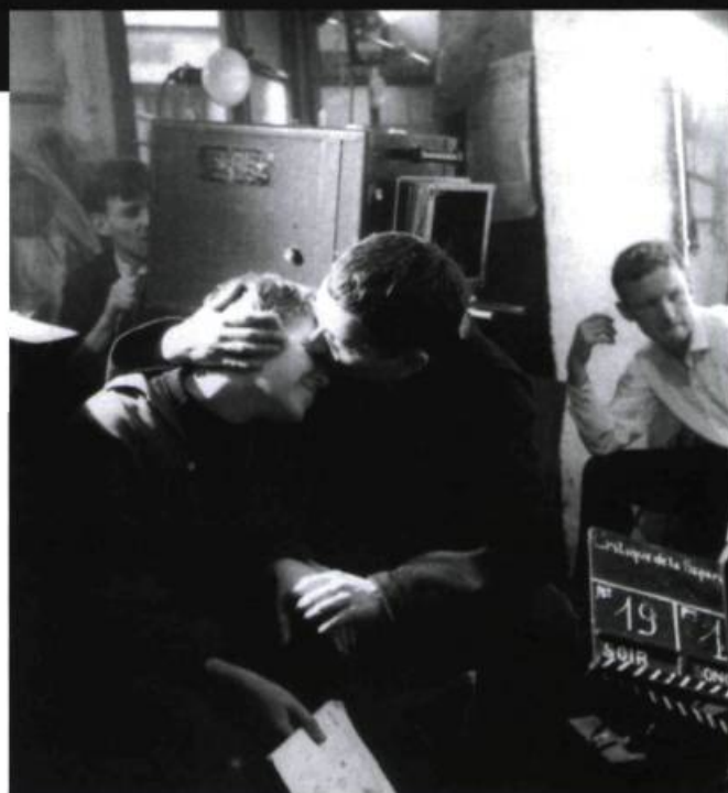
Critique de la séparation (1961)

Le temps qui compte est celui qui ne se compte pas. Celui que Debord situait dans un Moyen Âge idyllique présenté comme le temps de l'unité, de la conception au produit fini, le temps de l'artisan (contre la mécanisation, la marchandisation et le fonctionnalisme) et du savoir-faire, le temps d'avant la division du travail, de la communauté idéale, de la production pour l'usage et non pour la vente, le temps d'avant la falsi-