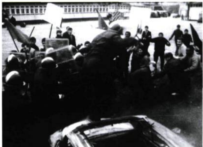
La société du spectacle (1967)