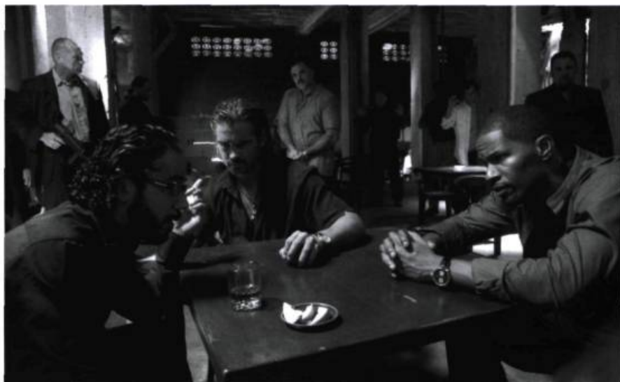
Mann retrouve dans Miami Vice les seuls personnages qu'il soit vraiment capable de filmer : les policiers et les criminels.