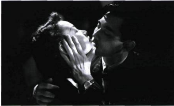
Good Men, Good Women (1995)

D e ses premiers films commerciaux aux derniers, son parcours est pourtant presque classique : un travail balisé par une cohérence faite d'une série d'évolutions et de glissements progressifs. Ce Chinois d'origine est également acteur et producteur; il consacre toutefois, depuis 2000, l'entièreté de son temps à la réalisation. Figure de l'auteur complet, il a, comme l'écrit Olivier Assayas, transformé l'idée qu'on se faisait du cinéma chinois avant les années 1980'. La connaissance de la biographie de Hou Hsiao-hsien peut aider les Occidentaux à entrer dans une œuvre au premier abord difficile parce que inspirée en grande partie par l'histoire de son pays d'origine et celle de son pays d'adoption, histoire transformée par la dialectique que Hou pose entre l'espace privé et l'espace public, établissant dans le continuité spatio-temporelle de ses récits une vision symbolique de la rencontre de l'ancien et du moderne et en jouant de la proximité et de l'éloignement, de l'observation et de l'engagement – qui fait indubitablement de lui un grand contemplatif.