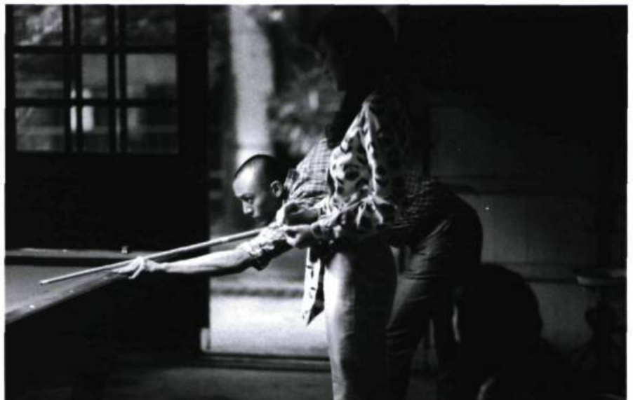
Three Times (2005)

Résolument contemporain, logiquement expérimental, totalement original, tel apparaît le cinéma du Taïwanais Hou Hsiao-hsien, que les spectateurs occidentaux ont découvert avec Un temps pour vivre, un temps pour mourir (1985), film qui marquera aussi la reconnaissance mondiale du cinéaste dont le succès de l'œuvre ira en grandissant au fil des ans. Considéré comme le chef de file de la Nouvelle Vague taïwanaise, apparue au début des années 1980, HHH a construit en un peu plus de vingt ans et dix-sept films (son dix-huitième, Ballon rouge , est en postproduction) une œuvre d'un style et d'une richesse aussi uniques qu'exemplaires, qui fait de lui un auteur incontournable du paysage cinématographique actuel.