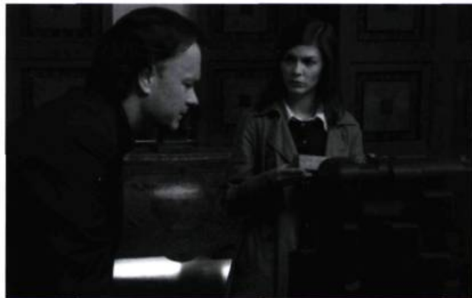
The Da Vinci Code de Ron Howard

sités – les blockbusters états-unis, bien entendu, plus un certain nombre de produits-vedettes nationaux, conçus dans l'esprit de concurrencer Hollywood –, l'immense majorité de la production mondiale compte sur des restes épars, et existe pour cette raison dans des réseaux parallèles qui possèdent leurs propres haut-parleurs promotionnels. Le circuit des festivals (avec en tête Cannes, Berlin, Venise, mais aussi Toronto, Sundance, Montréal, etc.) et sa distribution annuelle de bonnes notes constituent à