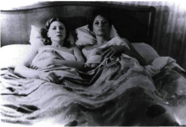
Les rendez-vous d'Anna (1978)

Sans parler d'Israël, bien sûr. Il y a 2,5 millions de Juifs à New York sur environ 10 millions de gens. Et il y a quelque chose de communautaire dans cette ville – et aux États-Unis en général – que les Français reprochent beaucoup à l'Amérique, d'ailleurs. Il y a donc des poches juives un peu partout dans New York. Mais cette culture que j'appellerais yiddishisante , il n'en reste plus beaucoup par rapport à ce