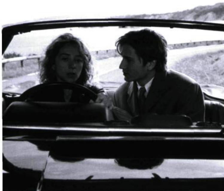
La captive (2000)

Il n'y a pas beaucoup de place pour cela. C'est-à-dire que ça dépend des films. Pour Toute une nuit , je n'avais que des petites notes : elle entre dans un café, s'assoit et deux verres tombent, etc. Et je ne savais pas non plus dans quel ordre tout cela allait se retrouver. Je savais comment je commencerais et je savais que l'orage aurait lieu à la fin de la nuit, mais entre les deux je ne savais pas. C'est au montage que tout s'est décidé.