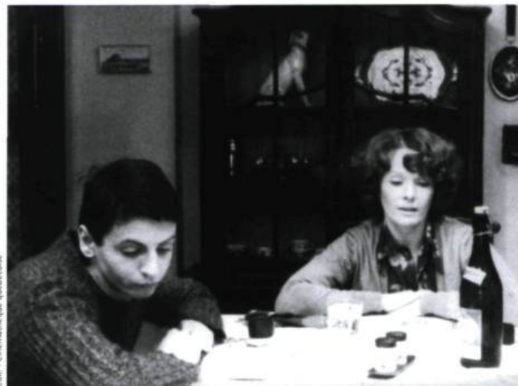
Jeanne Dielman (1976)

On me dit : « Pourquoi ne vas-tu pas en Espagne, là où crèvent des réfugiés africains ? » Je réponds que je l'ai déjà fait, ce film. L'Europe en ce sens ne diffère pas des États-Unis. L'histoire de James Byrd Jr, que j'aborde dans Sud , n'est pas tellement différente de ce qui se passe en Allemagne lorsqu'on met le feu à un refuge pour immigrés.