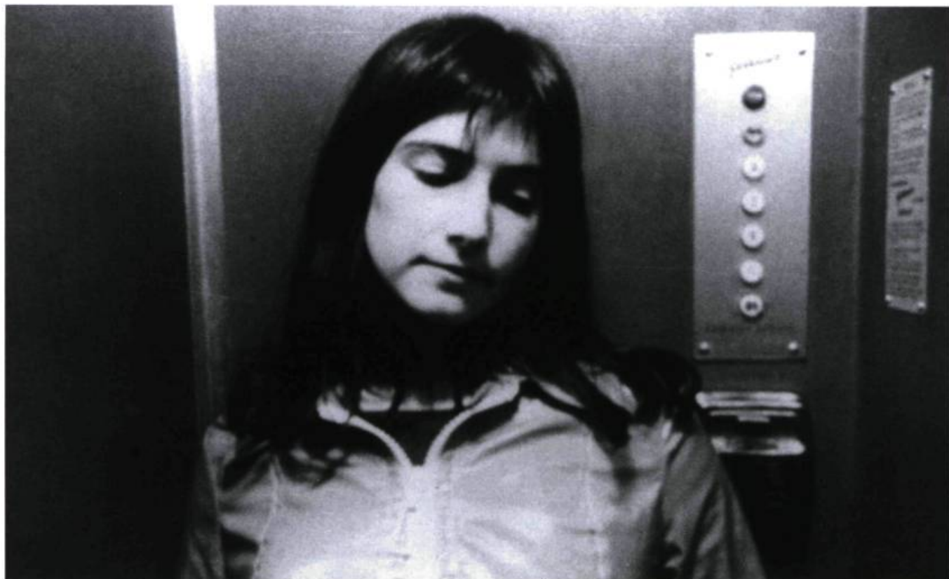
Chantal Akerman dans Je, tu, il, elle (1974)

Comment interpréter, dans ce film fait de longs plans, cette courte séquence en mouvement, vers la fin, qui évoque une attaque, un danger.