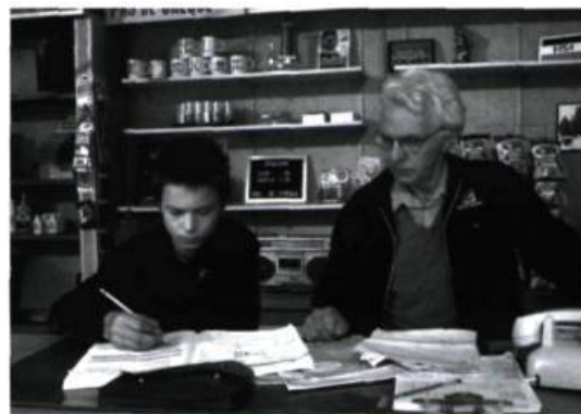
Gaz bar blues de Louis Bélanger