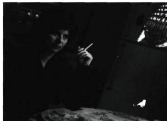
20h 17, rue Darling de Bernard Émond

C'est sans doute parce que je m'intéresse aux