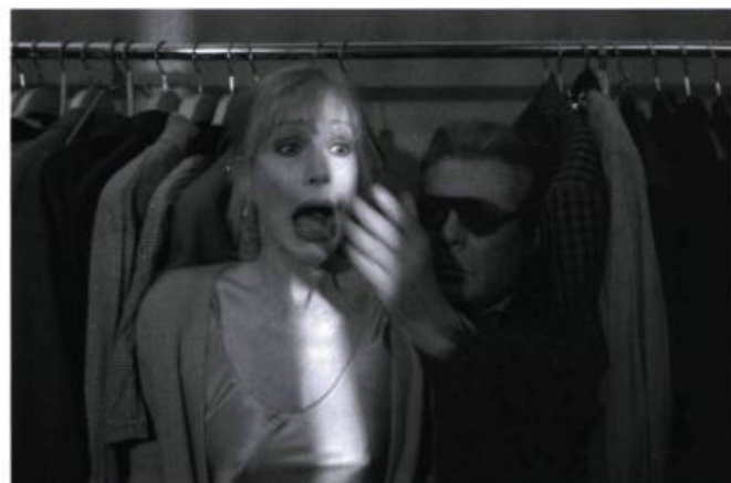
Ces photos, qui montrent Altman donnant des indications à Marcello Mastroianni et à Sally Kellerman, ainsi que celle de la page suivante ont été prises par Pierre Mignot lors du tournage de Prêt-à-porter (1994).