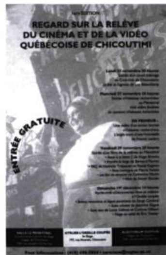
Affiche inaugurale de Regard sur le court métrage