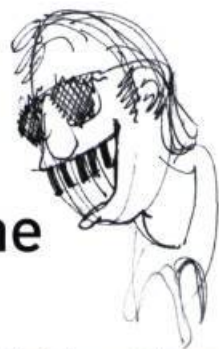
Ces dessins sont tirés du carnet personnel de Robert M. Lepage.

En tant que compositeur, comment abordez-vous la matière musicale et sonore d'un film ?