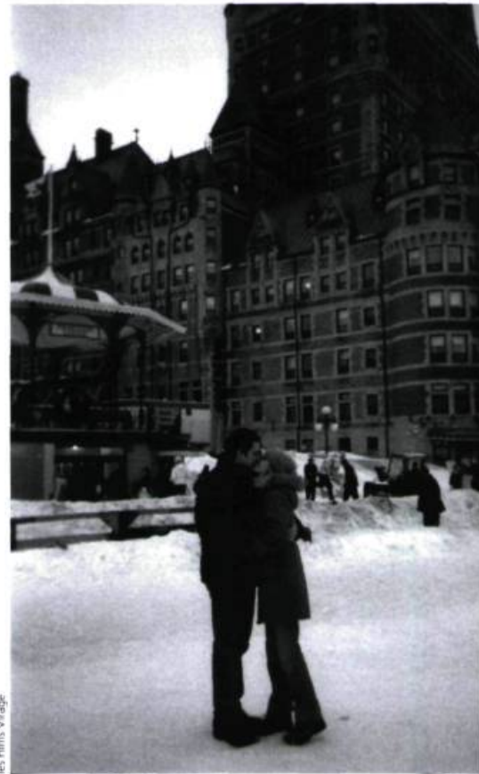
les films Vraque

D'autres films, plus difficiles à classer peut-être mais pour cette même raison souvent fascinants, ont fini par former dans notre esprit le groupe des « excentrés », films personnels qui donnent son sens au concept de documentaire d'auteur. Le plus surprenant est peut-être Valery's Ankle , de Brett Kashmere : construit uniquement au moyen d'images d'archives (certaines travaillées numériquement), ce petit film d'une vingtaine de minutes part du prétexte de la série du siècle (URSS-Canada, en 1972) pour mener une charge extrêmement habile contre la violence au hockey; l'effet cumulatif des scènes de violence, assénées à répétition au spectateur, finit par composer une étrange rhétorique pour le moins efficace. De son côté, Carole Laganière, toujours pertinente, offre avec Parc Lafontaine, petite musique urbaine un film un peu en dessous de nos attentes (il faut dire qu'elles étaient considérables, après son délicieux Country ); la galerie de personnages et de situations du célèbre parc montréalais qu'on voit se transformer au fil des saisons finit par composer un paysage un peu hétéroclite, quoique attachant. Mais le véritable coup de cœur va au film Posthumous Pickle Party , de Ezra Soiferman; on y rencontre un jeune Juif anglophone qui fréquentait, sur le boulevard Saint-Laurent, une boutique de fruits et légumes avant la mort de ses propriétaires, et qui revient sur les lieux avant que l'immeuble ne soit détruit. Il y découvre en compagnie d'autres habitués