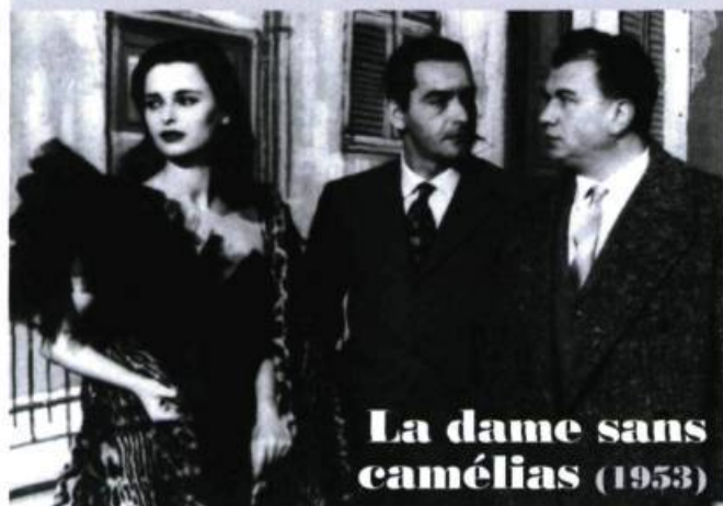
La dame sans camélias (1953)

Ce qui pourrait être un scénario à l'eau de rose ou une graine de mélo – la déchéance d'une petite Milanaise ex-vendeuse de tissu devenue star à Cinecittà – est aussi un drame de la jalousie, une tragédie de la condition féminine. Quand, à la fin, Clara (Lucia