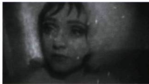
A Trip to the Orphanage (2004)