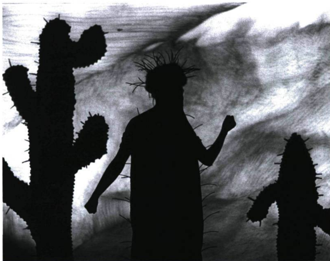
Odilon Redon or The Eye, Like a Strange Balloon, Mounts Towards Infinity (1995)

souvent rythmique, plastique, musicale, cinétique ou poétique que simplement narrative. Oh, il y a bien des récits, souvent minimaux, dans ces films : une femme pleure la disparition en mer de son amoureux Mundi ( Odin's Shield Maiden ), on essaie de ranimer le cœur malade de la Terre ( The Heart of the World ), une veuve se bat pour l'âme de son défunt mari ( Sombra dolorosa ), un homme marche tristement vers l'orphelinat, la nuit, accompagné du chant déchirant d'une femme qu'il appelle «maman» ( A Trip to the Orphanage ) ou encore une étrange histoire d'amour hermaphrodite semble naître de la cuisse d'un