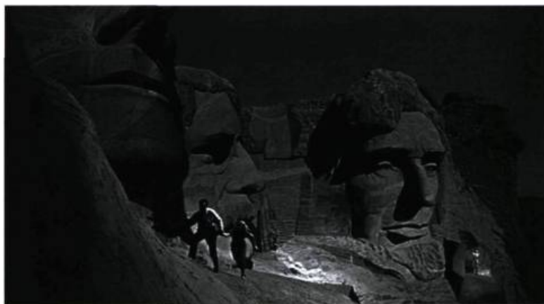
North by Northwest (1959) d'Alfred Hitchcock

Edison est roi à l'ère du progrès aveugle grisé par les avancées techniques, fruit de l'esprit scientifique et universel de l'Occident. L'image cinématographique va s'approprier le paysage alors que, en parallèle, sa proche cousine, la locomotive à vapeur, fournit le moyen de conquérir le territoire réel. Il était alors possible de « naturaliser » les vastes espaces sauvages. L'entreprise coloniale à l'ère du progrès industriel trouve dans les techniques nouvelles à la fois une idéologie et des moyens de conquête.