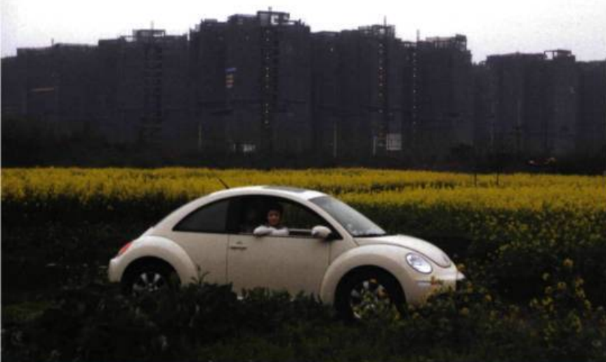
24 City de Jia Zhang-ke