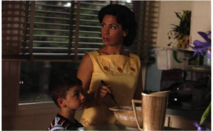
99 francs, qui a attiré plus de 1,2 million de spectateurs en France, aura fait au Québec moins du tiers des recettes qu'a rapportées Maman est chez le coiffeur .