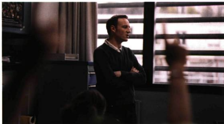
Entre les murs de Laurent Cantet, palme d'or du dernier Festival de Cannes. Qui décidera de la date de sortie de ce film au Québec?