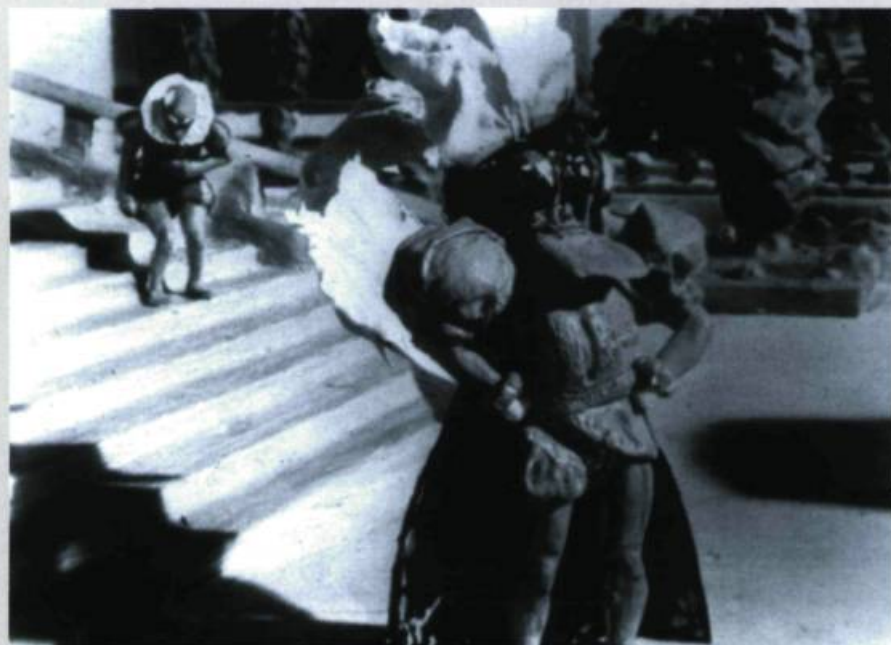
Barbe-bleue de Jean Painlevé et René Bertrand