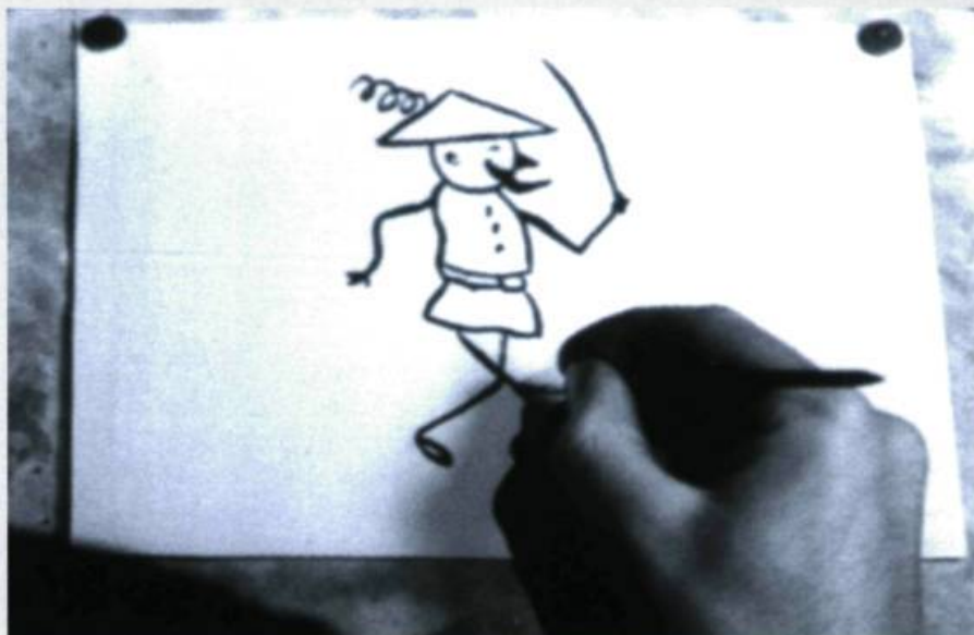
Au pays de la fantaisie . Un dessin d'Émile Cohl tiré d'un reportage intitulé Au pays de la fantaisie , réalisé en 1945 par Serge Griboff.

Dans un tel contexte, il faut applaudir l'initiative des Archives françaises du film du CNC qui ont mis sur pied un ambitieux projet intitulé Du praxinoscope au cellulo, un demi-siècle de cinéma d'animation en France (1892-1948) . Les trois volets du projet se déclinent ainsi : un cycle de 105 films d'abord projetés à la Cinémathèque française et que la Cinémathèque québécoise accueillera à partir du 5 décembre prochain ; un imposant catalogue de 350 pages grand format et comportant de nombreuses reproductions couleurs, dirigé par Jacques Kermabon qui a obtenu la collaboration d'une belle brochette d'auteurs (Pascal Vimenet, Jacques Drouin,