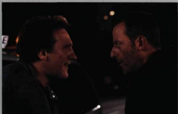
Tais-toi de Francis Veber