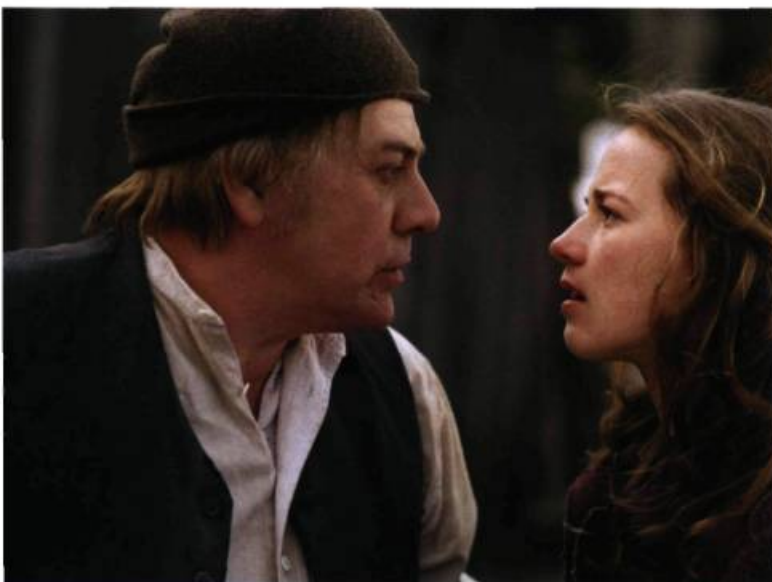
Quand les producteurs sont à l'origine de la production de films. Séraphin de Charles Binamé

C'est la conclusion que m'inspire la lecture de l'exhaustif rapport de synthèse du Club des 13 sur la situation du cinéma français en comparaison de celle des cinémas canadien et québécois. Et on ferait probablement un constat identique au sujet des cinémas nationaux du monde entier frappés eux aussi par le virus de la marchandisation et du formatage, de même que par l'érosion de la cellule scénariste-producteur-réalisateur, thèmes récurrents du rapport. Bref, « [o]n continue à vivre sur l'idée que le cinéma est à la fois un art et une industrie (puissance de la pensée d'André Malraux), alors qu'entre-temps, il est devenu essentiellement un commerce » (p. 7). Mais avant d'aller plus loin, deux mises au point s'imposent.