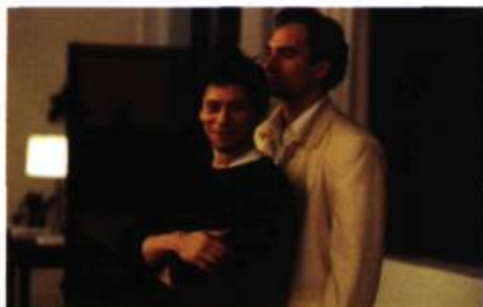
Comment je me suis disputé... (ma vie sexuelle) (1996)