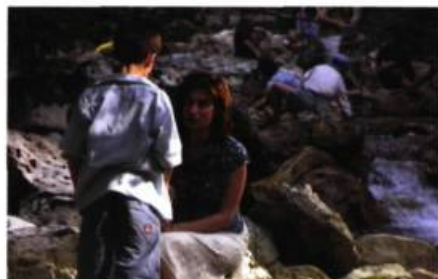
Rois et reine (2005)