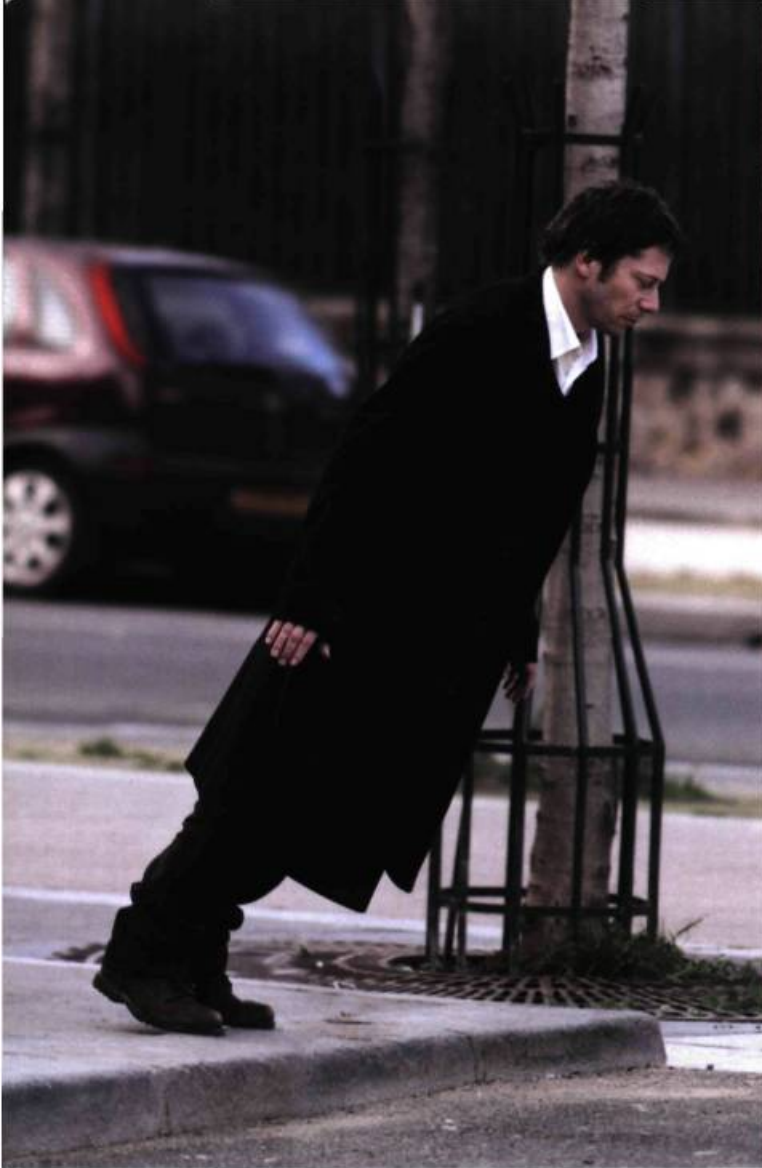
Mathieu Amalric dans Un conte de Noël

Dans Un conte de Noël, il est autant question de science médicale que de relations familiales. On pense à Rois et reine, mais aussi à La sentinelle et au thème de la bâtardise qui revient de film en film chez vous. Comment l'idée de ce scénario vous est-elle venue ?