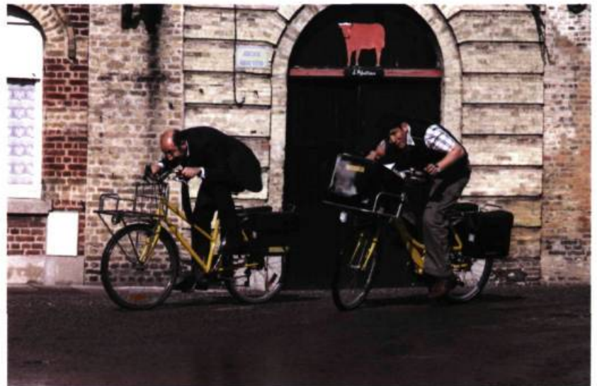
Bienvenue chez les ch'tis (2008) de Dany Boon