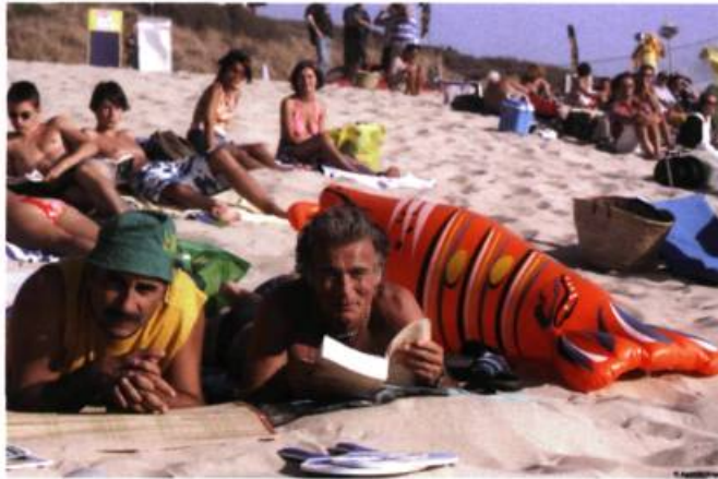
Camping (2006) de Fabien Onteniente