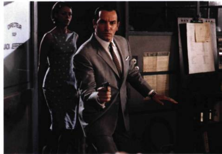
OSS 117: Le Caire, nid d'espions (2006) de Michel Hazanavicius

y avait un cinéma populaire qui permettait à un cinéma d'exister en marge avec Godard ou Pialat qui ont leur public, on leur dit que c'est ça le cinéma du dimanche soir et que ça doit être ça pour hisser le peuple à un niveau culturel intéressant. » C'est ainsi que Christian Clavier décrivait, avec sa légendaire subtilité, mais hélas de façon assez classique, dans les Cahiers du cinéma , l'incompréhension de la critique au sujet du cinéma qu'il incarne, au moment de la sortie des Visiteurs (n° 465, mars 1993). Camping , de Fabien Onteniente,