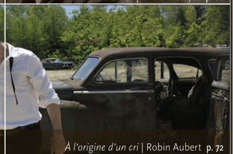
À l'origine d'un cri | Robin Aubert p. 72