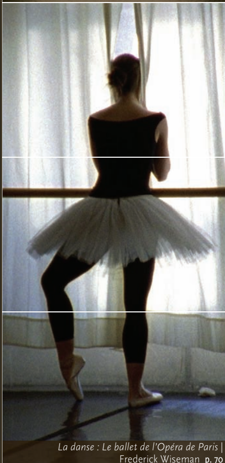
La danse : Le ballet de l'Opéra de Paris | Frederick Wiseman p. 70