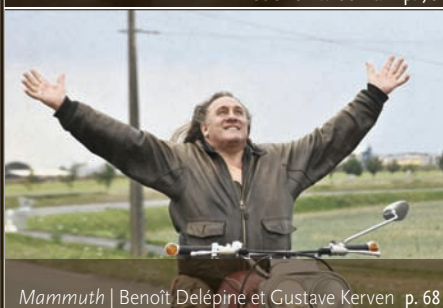
Mammuth | Benoît Delépine et Gustave Kervern p. 68