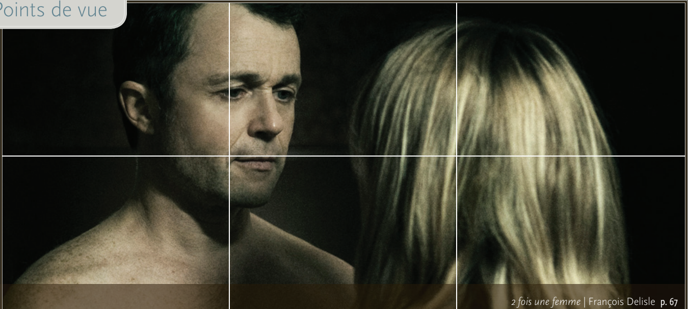
2 fois une femme | François Delisle p. 67