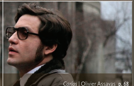
Carlos | Olivier Assayas p. 68