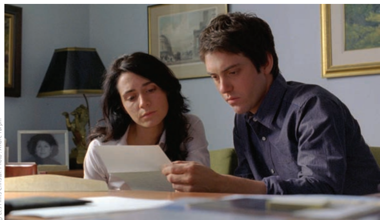
Incendies de Denis Villeneuve