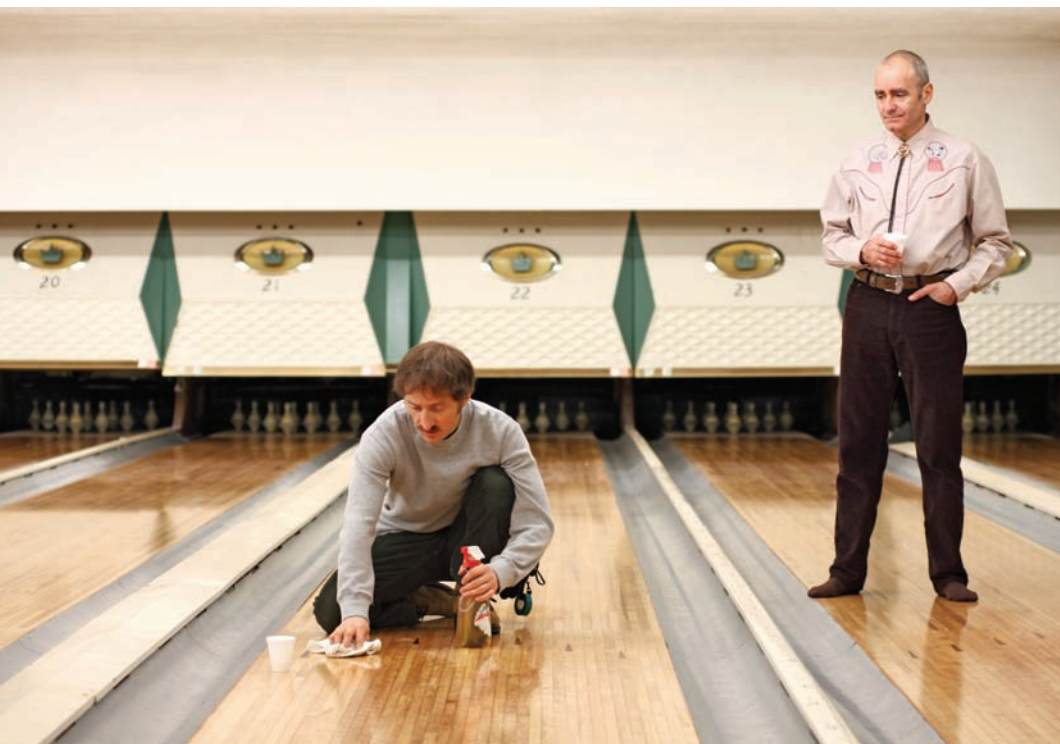
Curling de Denis Côté

constamment tendue, montage dynamique, absence de musique, le « style Podz », remarqué à la télé dans la série Minuit, le soir , a fini par s'imposer au grand écran. Cette forte présence esthétique, si elle est moins originale qu'il y paraît au premier coup d'œil, explique en grande partie la réception favorable que les deux films, en particulier les Sept jours du talion , ont reçue. Alors que le cinéma québécois fonctionne selon une division officieuse entre films d'auteur et productions commerciales de genre sans ambition esthétique, Podz semble vouloir changer la donne. Il prend manifestement ses sujets très au sérieux et propose un ton profondément dramatique aux antipodes de la production de genre habituelle. Cette approche explique en partie les propos d'Helen Faradji, pour qui « Les sept jours du Talion vient de faire entrer le cinéma de genre québécois dans son âge adulte ».