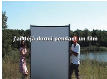
Le soleil brille pour tout le monde mais les hommes préfèrent les blondes (2008) de Sylvie Laliberté

Il y a dans ce Mémorial une salle où siègent des bustes de personnages historiques de l'époque. Sur chacun est projeté le visage d'un habitant marseillais anonyme d'aujourd'hui.