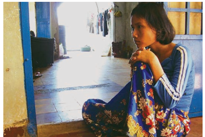
Le papier ne peut pas envelopper la braise (2007)

Oui, c'est une réécriture. Il faut connaître ses rushes par cœur. Si on a posé la même question une vingtaine de fois à différents moments du film, il faut voir comment la réponse a évolué. Bien sûr, on jette beaucoup, mais on voit très vite. Pour S21 , je cherchais les recoupements pour être sûr des faits. C'était le plus gros du boulot. Pendant le tournage, je passais mon temps à lire des confessions et là – quand je vous dis que je crois presque religieusement que les morts ne veulent pas mourir pour rien –, c'est étonnant... en lisant, je tombais sur des choses qui disqualifiaient soudain un témoignage antérieur. Pourquoi maintenant? C'est un grand mystère. Il y avait un gars notamment – je ne comprenais pas comment il avait pu rester interrogateur à S21 pendant presque trois ans – qui était dans un groupe que je qualifierais de « léger ». Je trouvais ça bizarre : en principe, l'expérience nous fait évoluer. Et un jour, je suis tombé sur un document qui prouvait qu'il était en fait dans le pire groupe. Je l'ai affronté. Et il a fallu tout recommencer à zéro et tourner à