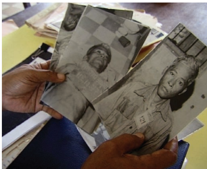
Duch, le maître des forges de l'enfer

nouveau ce qu'on avait filmé deux ans auparavant. Il faut donc avoir cette passion-là pour le montage. Il faut être sévère et ça, c'est le plus dur. Parfois, j'entends ma monteuse qui crie : « Ça, c'est nul ! » [rires]. Dans ces cas-là, je me casse [rires]. C'est vraiment le regard extérieur qui nous empêche de faire fausse route. J'aime beaucoup ce moment d'écriture. Je ne saurais pas faire le film sans aller au montage.