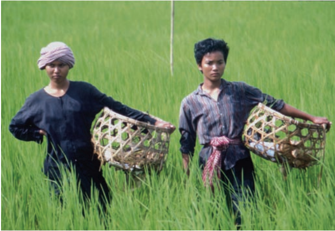
Les gens de la rizière (1992)

ne naît assassin. Tous les pauvres ne sont pas assassins. Maintenant on peut bien sûr se poser la question du mal et du bien. Le mal est toujours là, en nous. Mais même pauvre, on a la capacité de vaincre le mal. C'est comme ça que la civilisation continue. Le bien est toujours obtenu dans la souffrance. Ça n'a jamais été un cadeau de Dieu. Le bien est une œuvre de l'homme. Chaque jour est un combat. Et il faut que le cinéma épouse cette trajectoire. Je préfère arpenter un territoire qui est en ruine et poser des petits points de repère, ici et là.