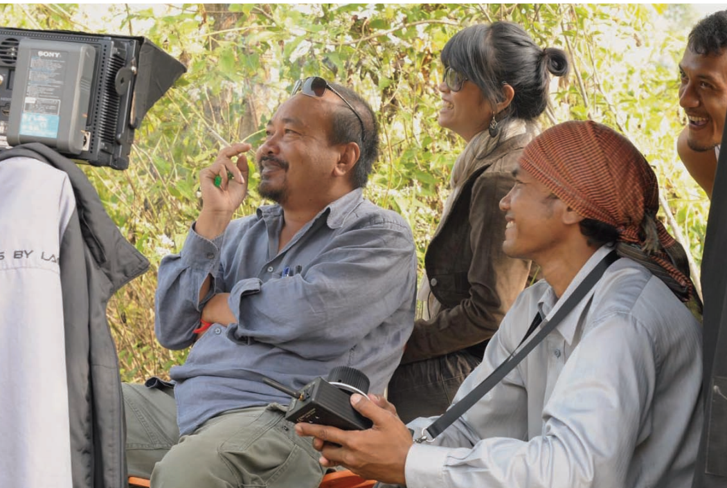
Rithy Panh sur le tournage de Duch, le maître des forges de l'enfer (2001)

pêcher autrement, à mains nues, ce dont j'étais incapable. J'ai découvert alors la dureté du travail de la terre, quand il faut repiquer le riz dans la boue avec le soleil qui vous tape sur le dos à 35 degrés. Plus l'idéologie, le régime et l'oppression. La première image à faire demandait donc de renouer avec ces bribes de souvenirs, ces identités brisées, d'essayer d'en recoller les morceaux. Parce que tout n'est pas bucolique, tout n'est pas violence. Est-ce que les Khmers rouges, qui étaient des paysans, étaient vraiment des tortionnaires, des tueurs ? Quelqu'un me disait hier, à Montréal : « les Khmers ont tué des Khmers », mais ce n'est pas vrai. C'est une idéologie qui a tué des Khmers. Ce sont les gens de l'extérieur qui pensent ainsi. Il faut remettre les choses en perspective. Que font les paysans ? Pourquoi se révoltent-ils ? Pourquoi ils deviennent Khmers rouges et assassins ? Personne