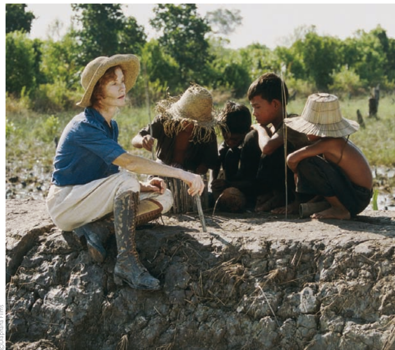
Un barrage contre le Pacifique (2007)

En 2003, vous présentiez S21, la machine de mort khmère rouge qui constitue le noyau dur de votre œuvre. Face à la folie meurtrière que votre pays a connue, vous avez voulu faire œuvre de transmission, construire une mémoire, un regard, une pensée. Comment s'est fait le travail en amont de ce film essentiel et hors normes ?