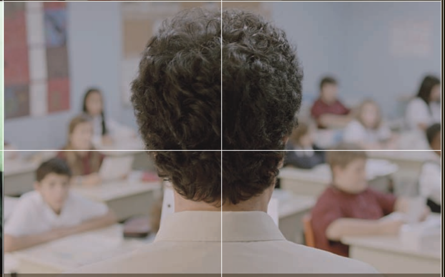
Monsieur Lazhar | Philippe Falardeau p. 58