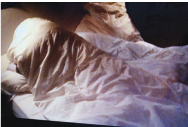
IRÈNE (2009) d'Alain Cavalier