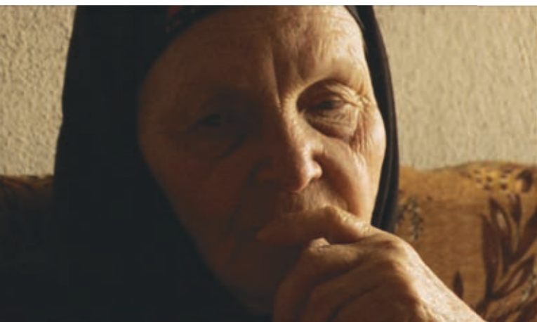
IL NOUS FAUT DU BONHEUR (2010) d'Alexandre Sokourov et d'Alexei Jankowski

Cependant, la présence de ce « je » dans les lieux qu'il arpente ne va pas de soi. En effet, contrevenant à la convention du documentaire classique, la voix se manifeste le plus souvent sur un mode interrogatif : « Où suis-je ? », « Pourquoi suis-je ici ? » Ces