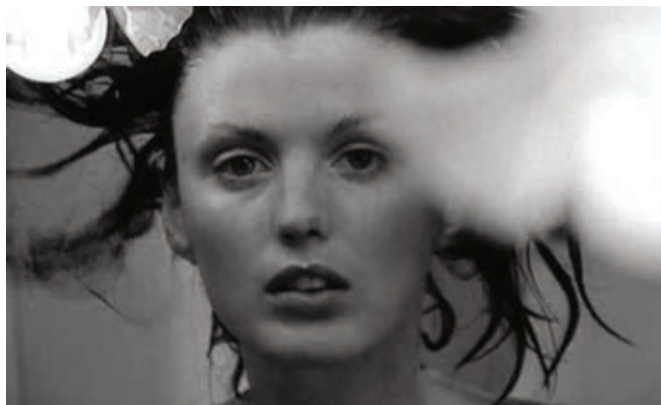
QUI ÊTES-VOUS POLLY MAGGOO? (1966)