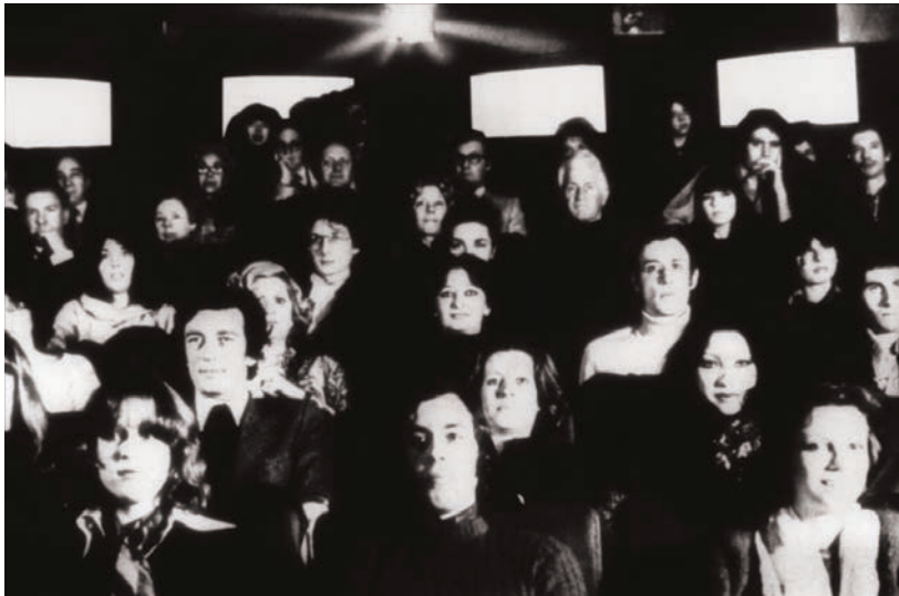
IN GIRUM IMUS NOCTE ET CONSUMIMUR.IGNI (1978) de Guy Debord

Tout transparent, tout est ouvert et tout est infini, entre ceux qui consomment intensément. Georges Bataille