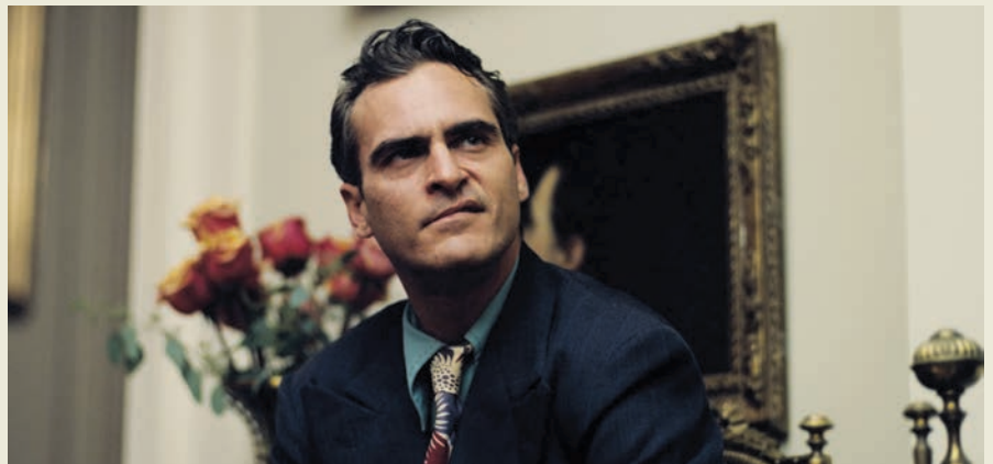
THE MASTER (2012)

place soudainement le récit sur le terrain de la fable. Le contraste irréconciliable qu'établit cette scène entre réalisme social et parabole morale dévoile non seulement un désir de briser les conventions, mais surtout d'intégrer dans le film un procédé de distanciation permettant d'observer les drames familiaux à l'œuvre dans la société sous une optique presque mythologique. Les personnages se transforment ainsi en figures symboliques d'un mal-être endémique aux conséquences apocalyptiques. Un mal-être qui, dans Magnolia , tourne essentiellement autour de la disparition et de la perversion de la figure paternelle.