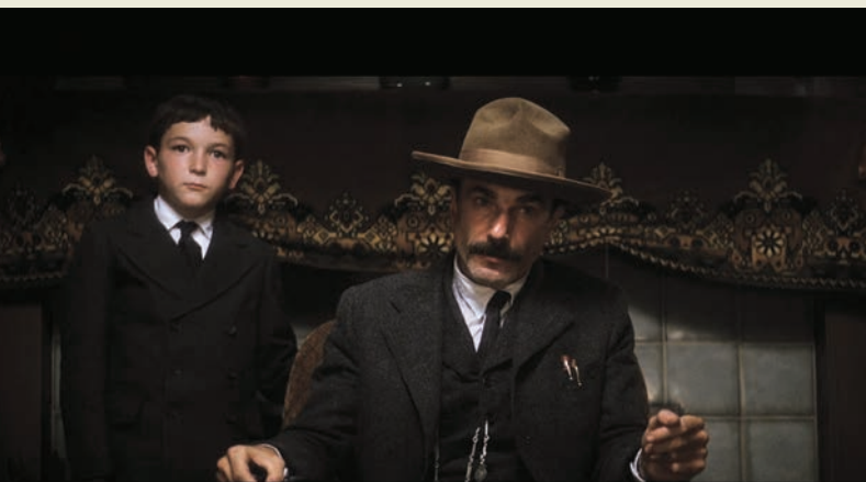
THERE WILL BE BLOOD (2007)