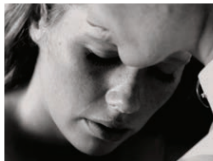
TROUBLE EVERY DAY de Claire Denis et PERSONA d'Ingmar Bergman