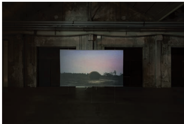
MAKING OF THE SPACESHIP et A DEDICATED MACHINE deux des vidéos qui composent PRIMITIVE (en bas, au Hangar Bicocca de Milan)

les extirper du refoulement et de l'oubli avant leur extinction, afin qu'elles puissent s'incarner autrement et permettre de repenser le monde. Dans le cas de Primitive on cherche, par la création de différents scénarios fictifs, à « implanter une mémoire » dans un lieu où les souvenirs sont éteints 2 . À travers Uncle Boonmee c'est du cinéma qu'Apichatpong désire se souvenir, en rendant hommage aux films qui ont marqué son enfance et qui aujourd'hui tombent dans l'oubli, les films thaïs en 35 mm à grand déploiement autant que les films aux décors de carton-pâte ou les feuilletons télévisés 3 .