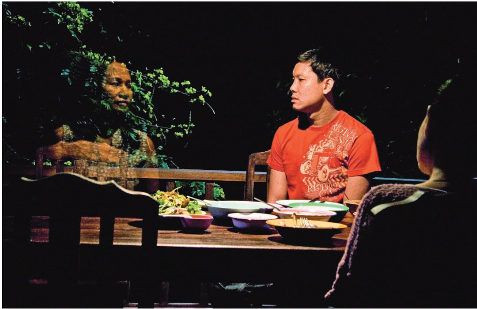
ONCLE BOONMEE, CELUI QUI SE SOUVIENT DE SES VIES ANTÉRIEURES (2010)

expérience d'un récit: la linéarité du fil narratif (ou du moins la possibilité de recomposer sa logique spatiotemporelle lorsque fragmentée), la différenciation des registres (fictionnel, documentaire), la séparation des modes d'existence et d'expression (fantastique, réaliste, poétique), des durées s'accordant à un rythme au service de la compréhension de l'action, etc. Rien de tout cela ne va de soi avec ce cinéaste, mais tout se passe comme si, en jouant avec les limites et en les brouillant, il nous faisait du même coup prendre conscience de celles-ci (du fait que nous en soyons dépendants) et de ce qu'elles signifient. Troublés dans nos attentes, sur le fil désormais tenu de notre appréhension, c'est paradoxalement avec plus de force et d'émerveillement que nous redécouvrons les pouvoirs du cinéma et y adhérons – à moins que, et cela se produit pour bon nombre de spectateurs, il faut bien le dire, le fil ne se rompe.