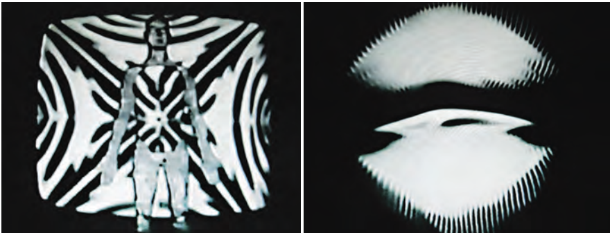
L'AMERTUBE (1972) de Jean-Pierre Boyer

QUAND ON ÉVOQUE L'ART VIDÉO CONTEMPORAIN, ON NE S'ATTARDE PLUS À VANTER CERTAINES MANIPULATIONS optiques du signal vidéo qui firent les beaux jours des œuvres pionnières. Les raisons sont pêle-mêle que le numérique facilite l'accès à d'innombrables effets spéciaux spectaculaires, que les esthétiques visuelles passent de mode de plus en plus vite, que les combats politiques sous-jacents aux expérimentations électroniques de l'image télévisuelle semblent obsolètes.