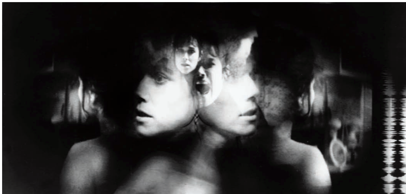
Barbara Hershey dans OUTER SPACE (2001) de Peter Tscherkassky

L'acteur dans le cinéma d'avant-garde occupe une place importante et trop peu discutée dans la littérature sur ce type de cinéma, que l'on considère l'œuvre de Maya Deren, les stars des Screen Tests d'Andy Warhol, les silhouettes qui apparaissent dans une désormais célèbre publicité de bière détournée par Peter Kubelka ou toutes ces figures anonymes de plusieurs films structurels 1 . Le cinéma de remploi ou de détournement, surtout lorsqu'il tire son inspiration des films de genre, réussit à accaparer les forces intrinsèques d'un acteur ou d'une actrice d'une façon si puissante qu'il en fait ressortir leur essence propre, leur talent à l'état pur. À ce titre, le réalisateur autrichien Peter Tscherkassky, plus précisément avec Outer Space (1999) et Dream Work (2001), second et troisième volets de sa trilogie en CinémaScope, se réapproprie de manière magistrale et délirante la présence de l'actrice Barbara Hershey dans le film d'horreur The Entity .